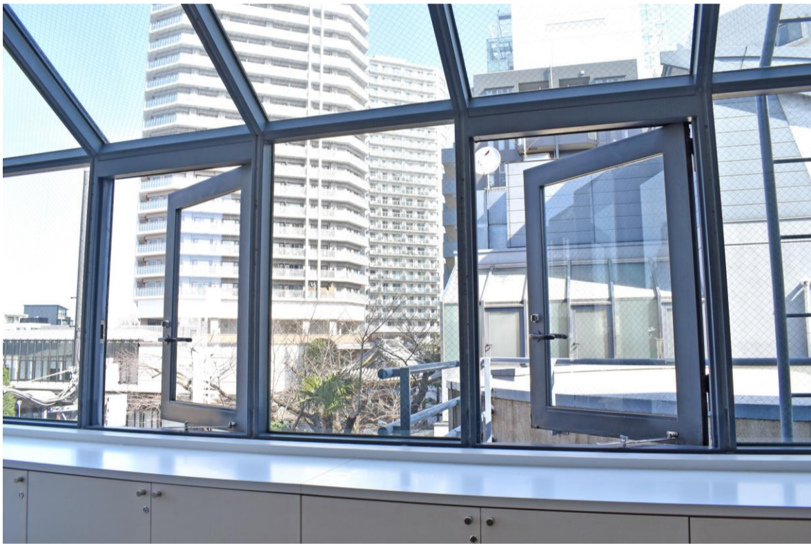
⑤教室の窓/ドアを開けて換気