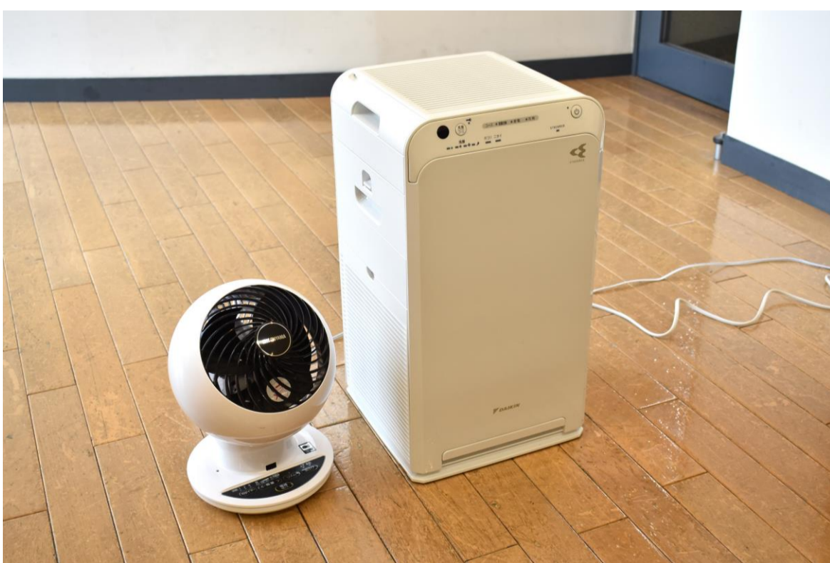
⑦空気清浄機/サーキュレーターを設置