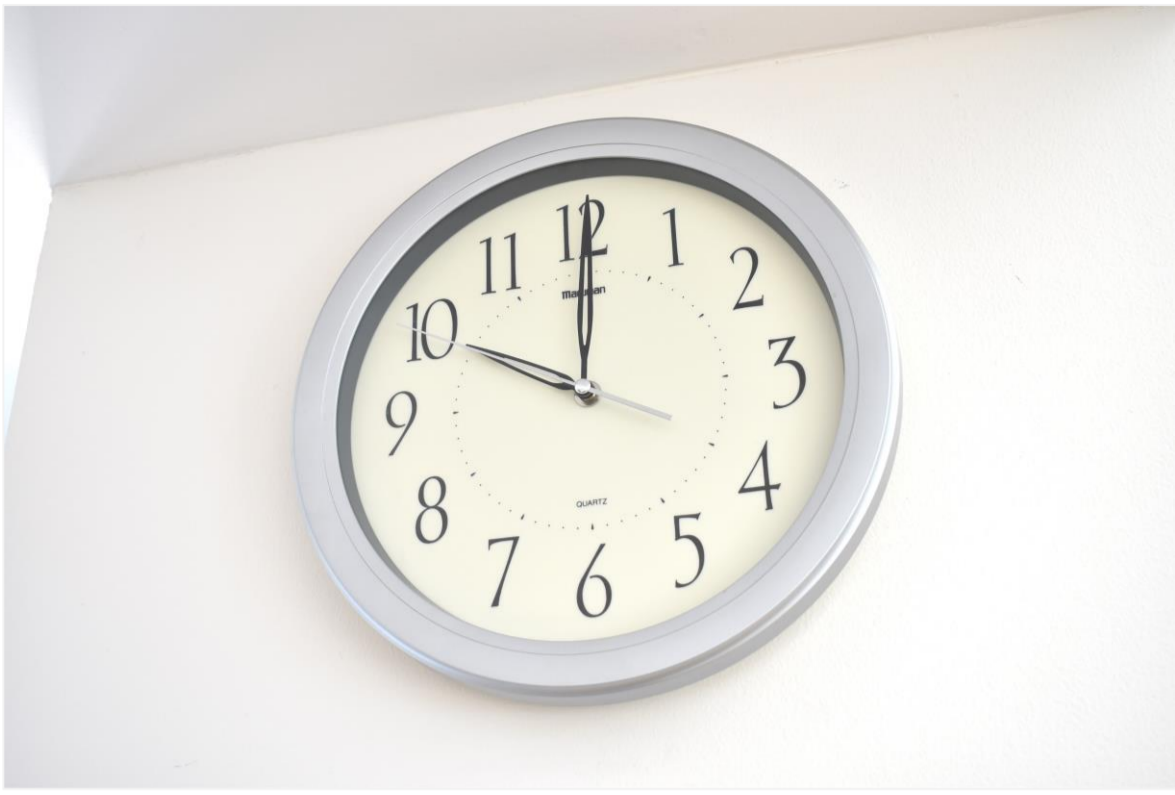
①ラッシュアワーを避ける時差登校 (10時授業開始)