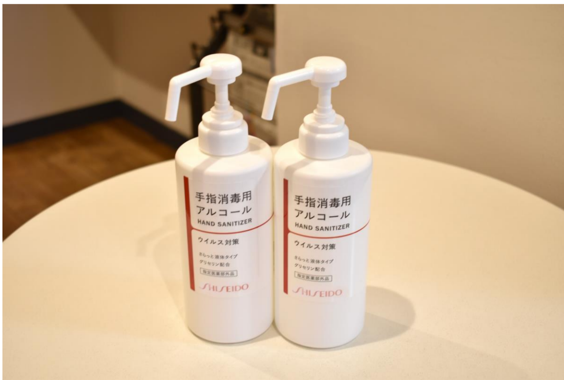
③入口での手のアルコール消毒