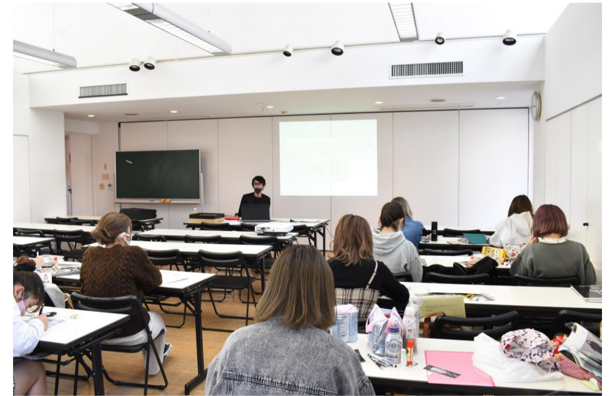
⑥密を避ける席の間隔