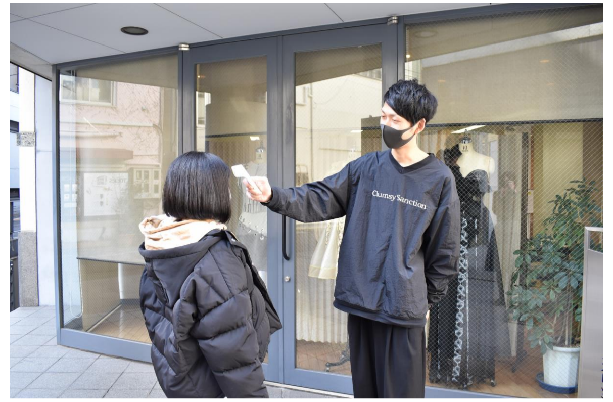
②毎朝玄関での検温