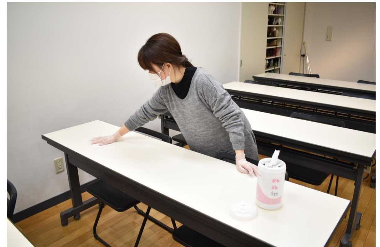
⑧毎日行う教室の消毒